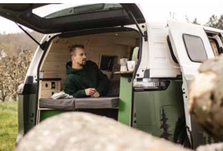
Black Forest Van

Dethleffs hat seine Reisemobil-Baureihe Trend auf Basis des Fiat Ducato innen und außen komplett überarbeitet. Den Trend gibt es als Teilintegrierten oder