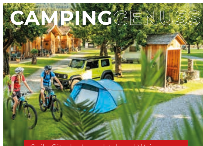
Gail-, Gitsch-, Lesachtal und Weissensee

Zwischen Dolomiten und den Kärntner Seen, im alpin-mediterranen Gail-, Gitschtal und Lesachtal, dem Weissensee und unweit des Pressegger Sees, sind die 8 Campingsterne Kärntens zuhause. Neben Wanderungen am Karnischen Höhenweg und Radstrecken rund um den Gailtal Radweg (R3), stehen eine Vielzahl von weiteren Aktivitäten und kulinarischen Schmankerln zur Auswahl. Im Winter sind 5 der 8 Campingplätze geöffnet und neben dem größten Skigebiet Kärntens, dem Nassfeld , bieten auch die kleineren Skigebiete in Kötschach-Mauthen und Weißbriach, sowie am Weißensee Abwechslung.