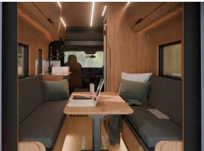
Alpine Cross Cabin

Die Reisemobil-Branche erlebte während Corona einen unverhofften Boom und beachtliche Verkaufserfolge. Nach Abklingen der Pandemie - und den damit verbundenen Lieferproblemen bei Basisfahrzeugen und Einbauteilen - hat sich auch die Nachfrage wieder beruhigt. Der Markt normalisiert sich. Die Hersteller reagieren mit neuen Modellen - und ersten Preisnachlässen.