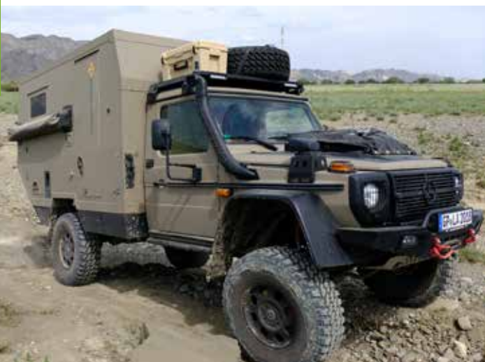
Langer &amp; Bock