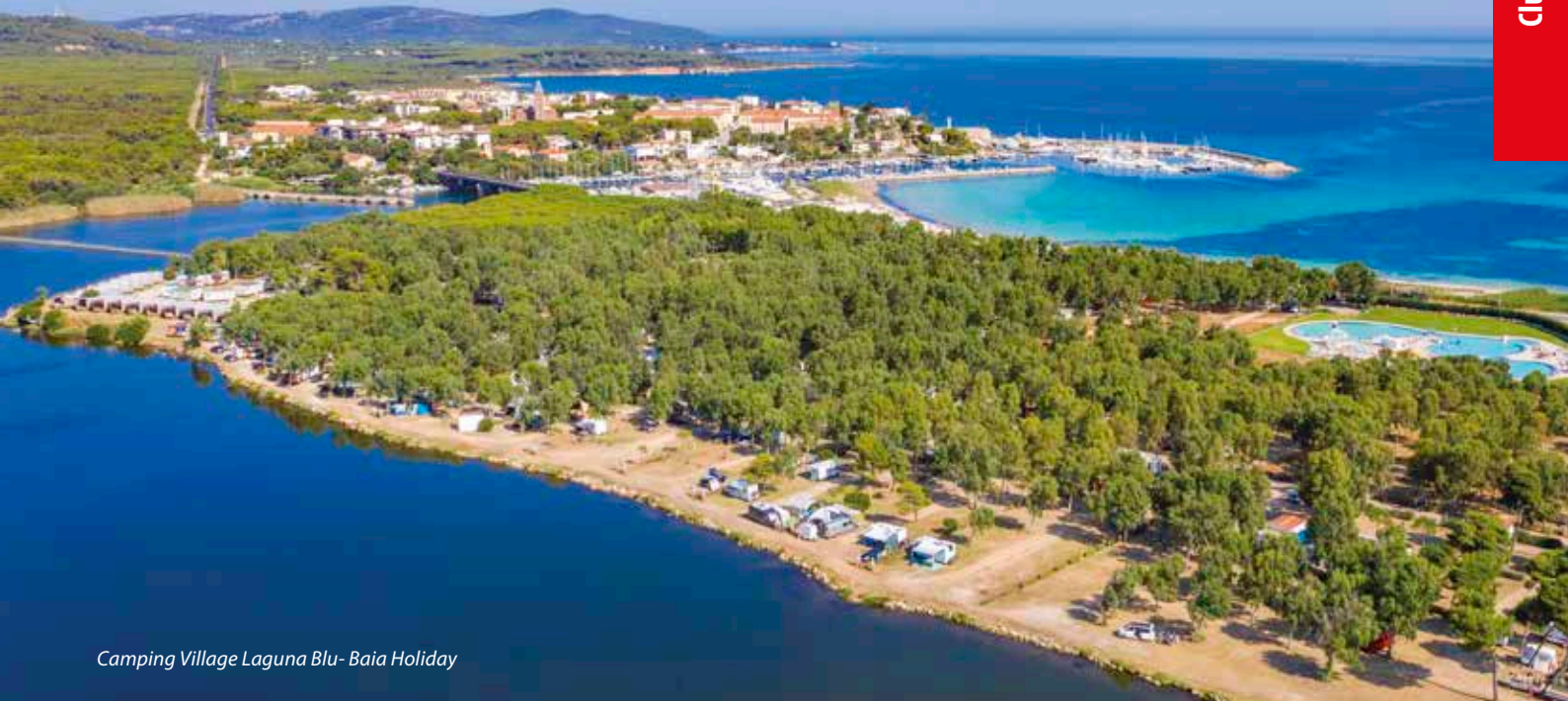
Camping Village Laguna Blu- Baia Holiday